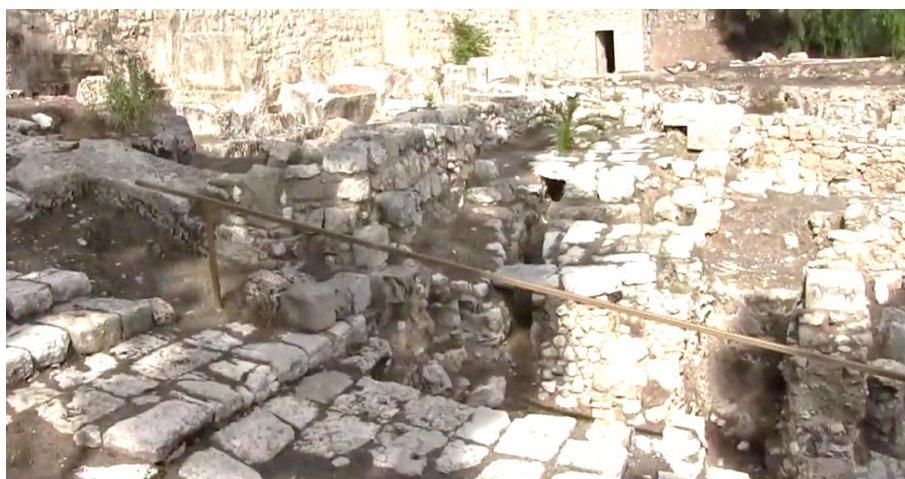
Abb. 4: die ‚Kirche von St. Petrus in Gallicantu‘ ist erbaut auf den Ruinen des angenommenen Gebäudes des Kajafas ist von überbaut

Diese Fotos als Screenshots wurden mit freundlicher Zustimmung von Holylandsites.com generiert!