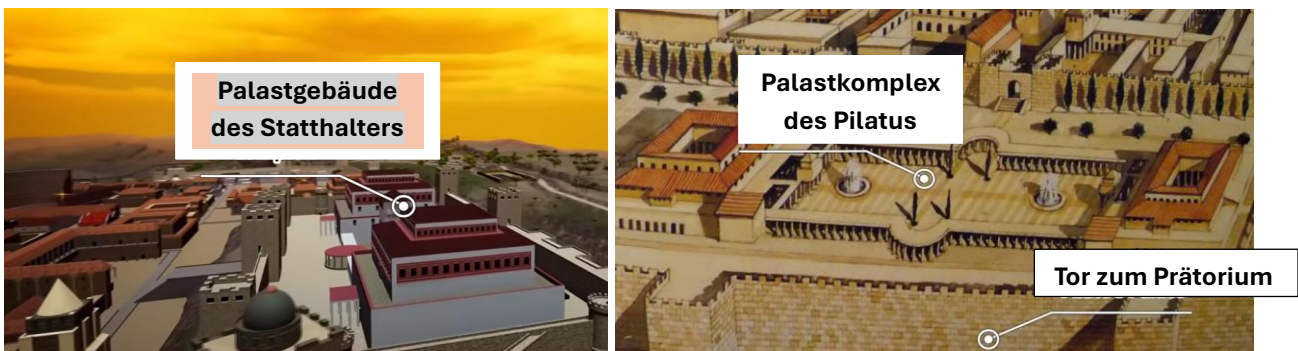
Abb. 5 u. 6 – 3D-Rekonstruktion des römischen Palastes, als ‚Prätorium‘ bezeichnet

Weil der Hohe Rat keine Todesstrafe vollstrecken durfte, Jh. 18, 31 , wurde Jeschua zu Pontius Pilatus gebracht, Jh. 18, 28–32 . Vor Pilatus wurde die Anklage bewusst verändert: Aus der innerjüdischen Gotteslästerung wurde ein politischer Vorwurf konstruiert – Jeschua habe sich als König ausgegeben und damit die römische Ordnung bedroht. Pilatus durchschaute sofort, dass es sich um eine religiöse Auseinandersetzung handelte, und suchte Wege, sich der Verantwortung zu entziehen.