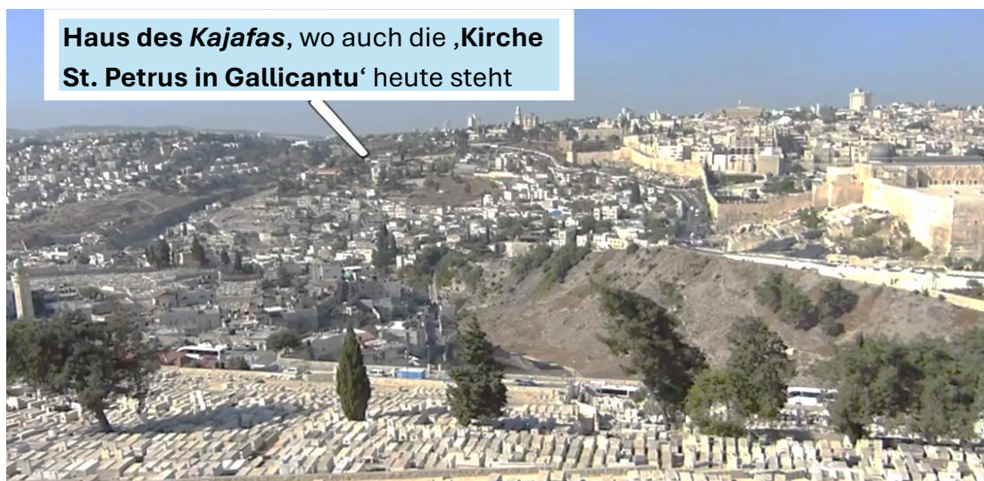
Abb. 1 - topografische Lage des Kajafashauses , Sicht vom Ölberg aus.

b) Im zweiten und entscheidenden nächtlichen Vorverhör trat schließlich Kajafas selbst hervor. Nachdem die Zeugenaussagen widersprüchlich geblieben waren und sich keine belastbare Anklage konstruieren ließ, stellte er Jeschua die direkte Frage: „ Bist du der Messias, der Sohn des Gesegneten? “, Mk. 14, 61 . Als Jeschua antwortete: „ Ich bin es “ und damit auf Dan. 7, 13 und Ps. 110, 1 anspielte, Mk. 14, 62 , zerriss der Hohepriester seine Amtskleider und rief: „ Er hat gelästert – was brauchen wir noch Zeugen? “, Mt. 26, 65 . Damit erhob er den schwersten denkbaren Vorwurf, Gotteslästerung , ein Kapitalverbrechen im jüdischen Recht. Die versammelten obersten Priester bestätigten das Urteil: „ Er ist des Todes schuldig “, Mk. 14, 64 . Unmittelbar nach dieser Eskalation entlud sich der aufgestaute Hass in einer erschütternden Welle menschlicher Bestialität: Sie spuckten ihm ins Gesicht, schlugen ihn mit Fäusten , gaben ihm Ohrfeigen und verhöhnten ihn: „ Weissage uns, Messias! “ Mt. 26, 67–68 ; Mk. 14, 65 . In diesem Moment fiel jede Fassade religiöser Rechtsfindung – die rohe, hässliche Gewalt menschlicher Natur trat ungebremst hervor. Da nächtliche Sitzungen rechtlich nicht gültig waren, wurde dieses Urteil am frühen Morgen in einer formellen Sitzung des Hohen Rates nochmals bestätigt, Mt. 27,1 ; Lk. 22, 66 .