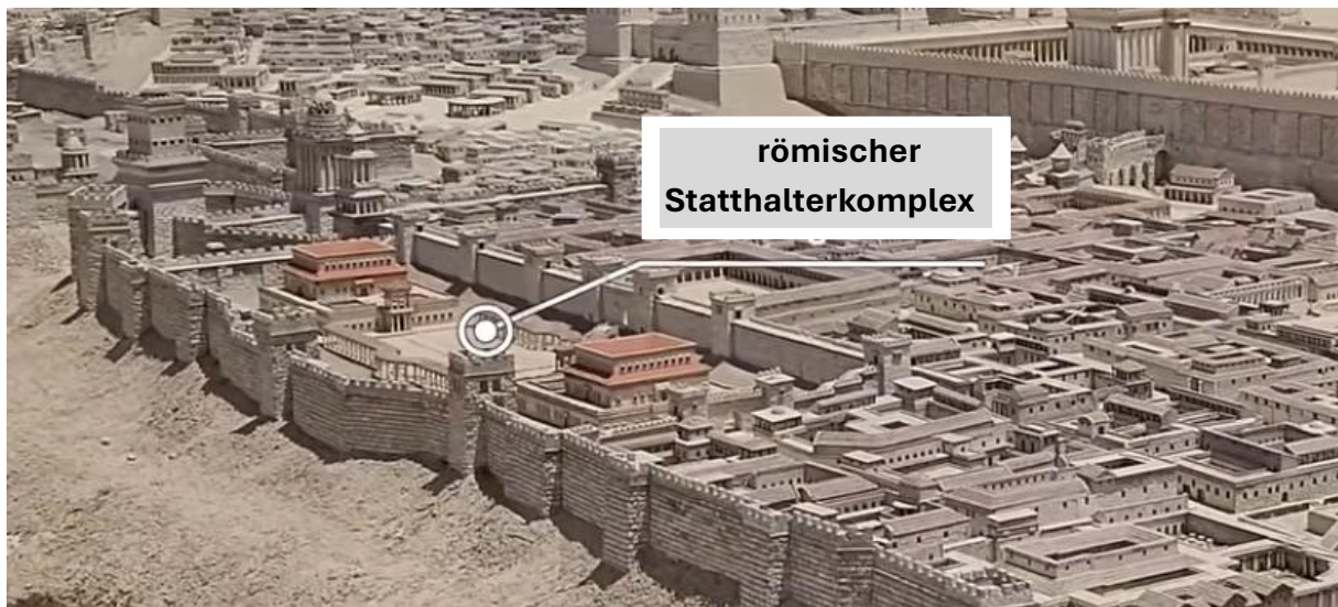
Abb.7 – Modell des römischen Prätoriums