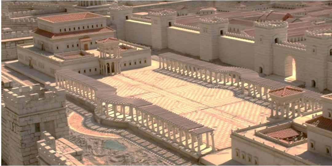
Abb. 8 – Modell des Palastes von Pilatus